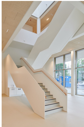
Foyer / Treppe

Die Gliederung der Bereiche von Foyer im Erdgeschoss mit Multifunktionsaal und Schlagwerkraum mit guter Erreichbarkeit für Nutzer und Besucher und auch der Anlieferung ist räumlich und funktional gut gelöst. Ebenso ist die Gliederung der beiden Obergeschosse mit Übungsräumen und Verwaltung um die geschickt positionierten Kerne für die Erschließung und Nebenräume gut und differenziert gelöst. Der Entwurf ist grundsätzlich gut realisierbar und liegt im mittleren Bereich aller wirtschaftlichen Kennzahlen, lediglich im Anteil der Verkehrsflächen ist er überdurchschnittlich. Kritisch merkt das Preisgericht an, dass die offene Ausrichtung des Foyers nach Südwesten sowie die damit verbundene Auskrugung des massiven Gebäudeteils nicht die gleiche städtebauliche Bedeutung wie zur Straße und nach Nordosten mit dem Eingang hat und in diesem Bereich eine Verbesserung sowohl von architektonischer sowie städtebaulicher Haltung als auch der Wirtschaftlichkeit möglich scheint. Ebenso fehlt eine Differenzierung der Auskrugung über den drei Glasfassaden des Foyers entsprechend ihrer städtebaulichen Bedeutung.