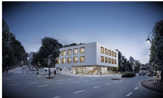
Perspektive Wettbewerb, Ecke Hochstraße / Staberger Straße