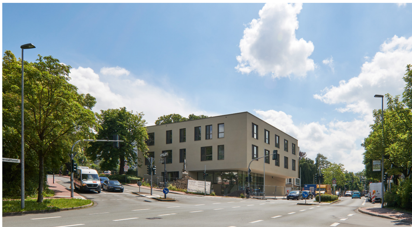
Fassade 'Staberger Straße' mit Haupteingang

Die klare Fassade stellt mit Ihrem einfachen und geometrischen Fassadenprinzip dabei womöglich einen gewünschten Bezug zur Lüdenscheider Altstadt dar. Der Klinker als schönes, haptisches aber auch dauerhaftes und zeitloses Material für Gebäude und Freiraum ist dabei die richtige Wahl. Kritisch angemerkt wird, dass die Fassade anstatt der Symmetrie etwas mehr Spannung aufbauen könnte.